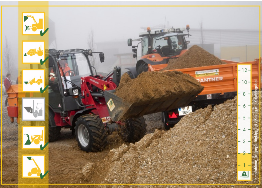
Die Schwergutschaufel ist geeignet für schwere Ladegüter und Erdarbeiten.