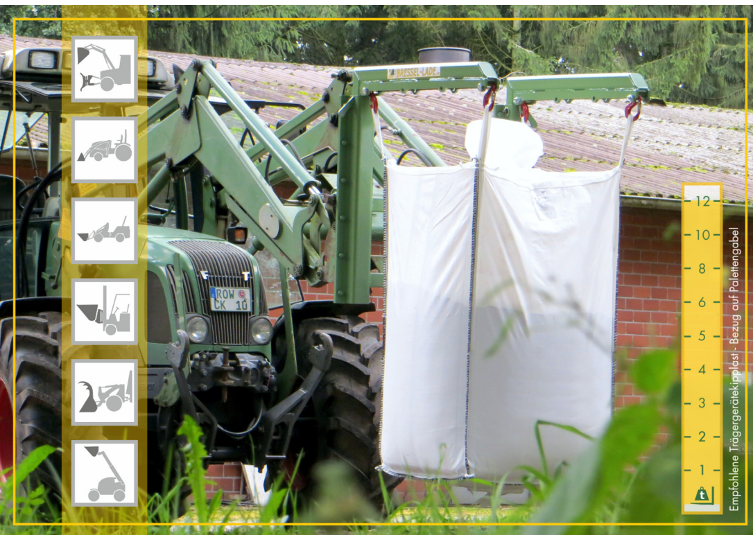
2 Stück dieser Big-Bag-Träger erlauben den Transport von Big-Bags mit einem Standard-Gabelträger.