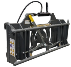
Euro / Euro