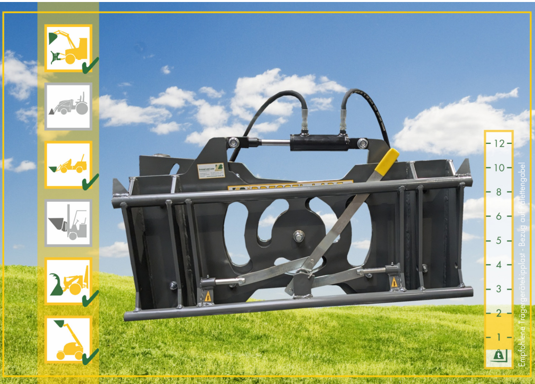
Euro / Euro